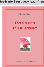
Fables, conte, nouvelle, 104 pages