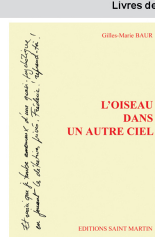
Roman, 162 pages