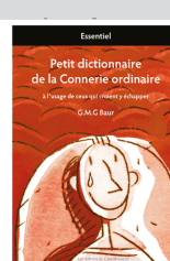
Dictionnaire humour, 172 pages