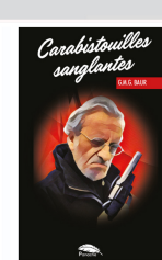
Polar, 200 pages

Livres de Gilles-Marie Baur : www.baur-fr.eu