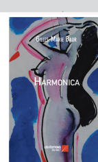
Roman, 404 pages